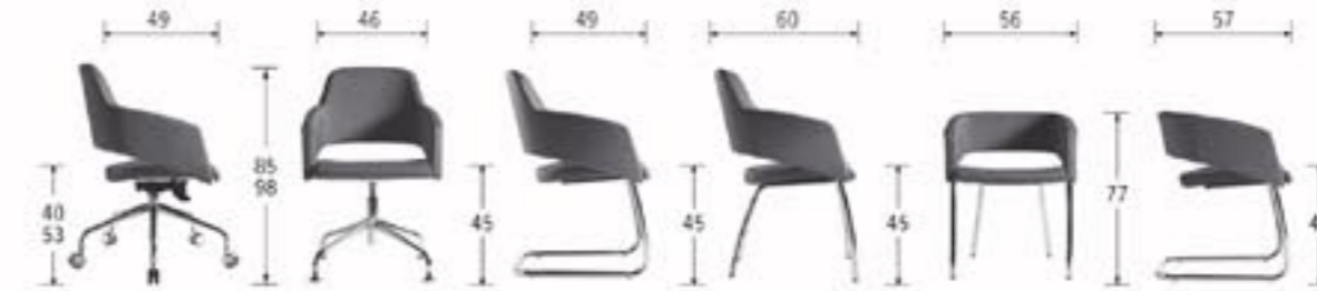
Alta con slitta High back with sled base