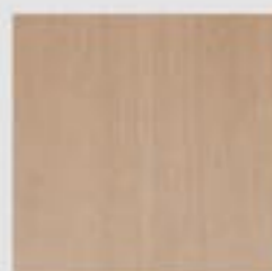
Rovere sbiancato / Whitened oak

La versione di Major con rivestimento legno a vista offre la scelta di 4 diverse essenze pregiate per armonizzarsi al meglio negli ambienti dove è collocata