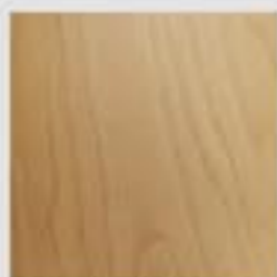
Faggio / Beech

The version of Major with in view wooden covering is offered with 4 different precious essences to be in tone within the areas where it will be placed