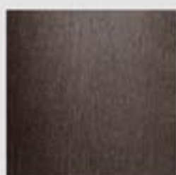
Wengé / Wengé