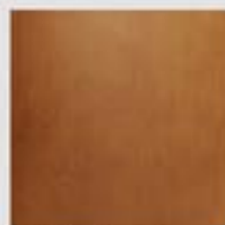
Ciliegio / Cherry